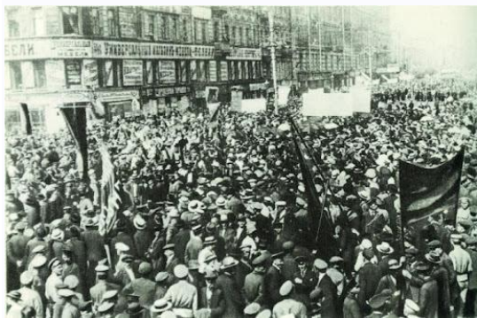
Рис. 5. Демонстрация в Петрограде, на которой выступил В. И. Ленин с призывом проведения мирной демонстрации под лозунгом «Вся власть Советам»

Фактическая власть (возможность влиять на ситуацию) была только у тех, кого готовы были слушать вооружённые массы солдат (в столице и на фронтах) и рабочих, захвативших оружие в столице. Уже с марта 1917 г. влияние на них могли оказывать только представители социалистических партий (эсеры, меньшевики, большевики), которые были избраны в общественные Советы рабочих, солдатских, а позднее и крестьянских депутатов уездов, губерний, столичных городов. Установилось двоевластие — формальная власть была у Временного правительства (из министров-«капиталистов» — членов либеральных партий), а реальная — у Советов (социалистические партии), которые, однако, стремились лишь контролировать действия Временного правительства до Учредительного собрания. Это двоевластие с апреля по сентябрь порождало кризисы во Временном правительстве и вело к смене его партийного состава. С каждым разом доверие к новой власти снижалось.