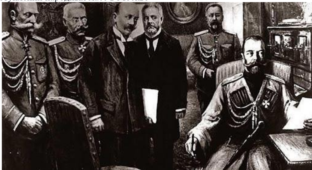
Рис. 2. Подписание отречения от престола Николая II

27 февраля — начало открытого перехода солдат запасных гвардейских полков на сторону восставшего народа. Начало «солдатского этапа» революции. Соединение рабочего и солдатского движений в Петрограде. Разгром восставшими рабочими и солдатами здания Окружного суда на Литейном проспекте. Освобождение ими подследственных, находившихся в Доме предварительного заключения. Активизация деятельности Государственной Думы, выдвинувшей политические требования Николаю II о смене правительства. Начало перехода на сторону Думы командующих фронтами (А. А. Брусилов, Н. В. Рузский). Непрерывное вовлечение в восстание против старой власти новых воинских подразделений. Превращение Таврического дворца в «штаб» революции. 28 февраля — начало выступлений народных масс в Москве